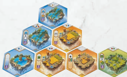
Cet univers est légal.

Si l'on respecte scrupuleusement ces règles, on peut parfaitement commencer le deuxième étage, voire le troisième, avant même d'avoir terminé son premier étage de 5 tuiles.